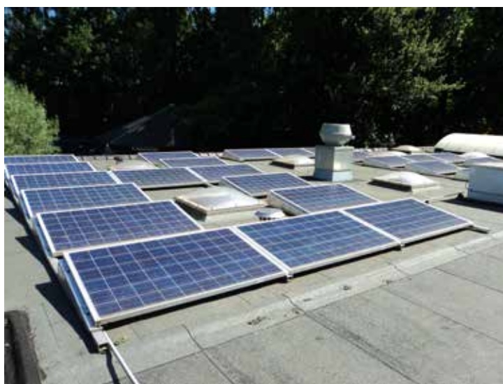
Zonnepanelen op het dak van de Fûgelhelling

Op dit moment wordt het afval al gescheiden, dit kan echter nog verder worden geoptimaliseerd. Voorlichting en bewustwording aan vrijwilligers en stagiairs over duurzaamheid, energiegebruik en afvalscheiding is van een wezenlijk belang in het verder vergroenen van de Fûgelhelling.