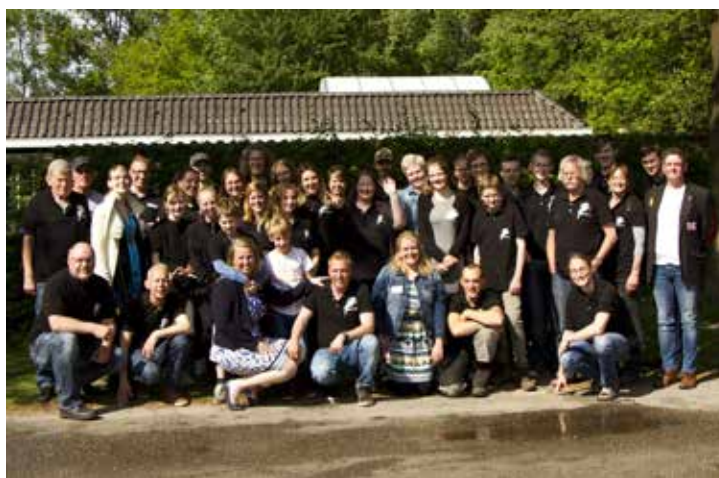
Trots op onze vrijwilligers op open dag 2017

Het vrijwilligersbeleid is ruim onder de maat. Vrijwilligers ontvangen geen enkele vergoeding. Uiteraard worden kosten, die worden gemaakt ten behoeve van De Fûgelhelling wel vergoed. Er worden wel low-cost uitstapjes en activiteiten georganiseerd en elk jaar is er voor elke vrijwilliger een kerstpakket. In 2018 wordt begonnen met het geven van een reiskosten vergoeding. Van alle vrijwilligers wordt geëist, dat zij de doelstellingen van de Fûgelhelling onderschrijven en wordt betrokkenheid bij de gang van zaken verwacht. Door de grote groep vaak wisselende medewerkers zijn alle werkzaamheden vastgelegd in huisregels en protocollen. Periodiek zal aandacht moeten worden besteed aan het actueel houden van deze regels. Om te zorgen dat dit en andere zaken bekend wordt bij de vrijwilligers zal een vrijwilligersnieuwsbrief maandelijks per mail worden verstuurd. Nieuwe ontwikkelingen kunnen ook besproken worden op vrijwilligerscursussen, opgehangen op info-bord en tijdens het werkoverleg 's ochtends.