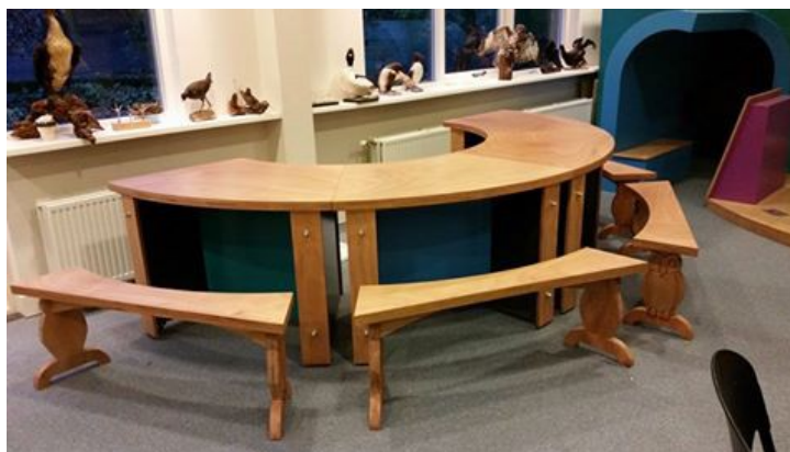
Pluistafel in educatieruimte

Voor educatie/voorlichting aan onze bezoekers is een goede inrichting van ons bezoekerscentrum een voorwaarde. Ook Douwes Gea is vaak onderdeel van een rondleiding. Komende jaren zal het bezoekerscentrum verder uitgebreid worden en bij Douwes Gea zal vernieuwing blijven doorgaan, zodat bezoekers blijven terugkomen. Om kinderen te blijven trekken wordt binnenkort begonnen zo nu en dan op een woensdagmiddag een kidsmiddag aan te bieden, doel is uiteindelijk elke maand dit 1 keer te organiseren. Het aanbieden van deze educatiemogelijkheden vraagt natuurlijk ook om deskundige leiders. Een algemeen voorlichtend verhaal en een rondleiding kan worden gedaan door iemand, die met de gang van zaken en de doelstelling op de hoogte is.