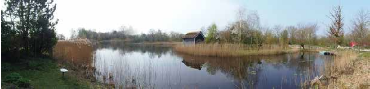
View over Douwes Gea

Een niet onbelangrijk deel van het terrein van De Fûgelhelling bestaat uit het mooi natuurgebiedje "Douwe's Gea". Met zijn grote vijver, een wal voor oeverwaluwen, een insectenmuur, kijkhutten en een natuurlijke gevarieerde begroeiing, dient het niet alleen als nestplaats voor veel kleine vogels, maar leent zich ook uitstekend voor educatieve doeleinden. Groepsexcursies naar De Fûgelhelling worden dan ook vaak besloten met een leerzame speurtocht over ons terrein. Voor het onderhoud van dit mooie stukje natuur is een beheersplan (studieproject van leerlingen Nordwin college) geschreven. Het beheersplan en planmatig onderhoud zullen ook in de toekomst de educatieve waarde van dit terrein moeten ondersteunen.