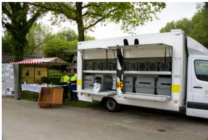
Dierenambulance personeel op Open Dag

Daarnaast worden interne cursussen aan dierenambulancepersoneel, tussenopvangmedewerkers en vrijwilligers gegeven. De eerste uren zijn cruciaal in de opvang voor de dieren, goede en directe zorg geven betere overlevingskansen. Met cursussen wordt gezorgd voor efficiënte eerste hulp en tevens wordt geleerd hoe hoe het dier te behandelen, zowel veilig voor mens en dier.